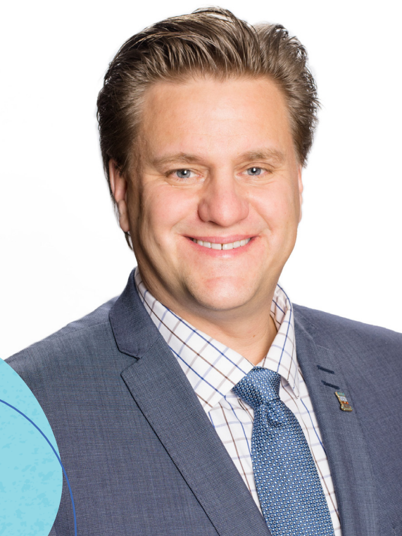
YVES MONTIGNY Maire de Baie-Comeau